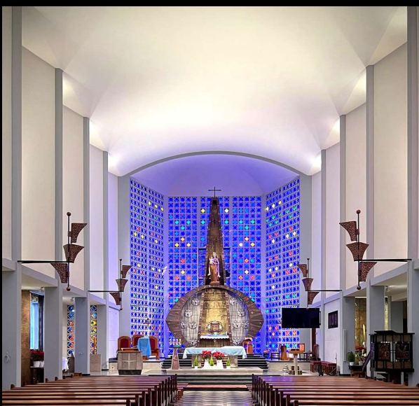
Efekt nowej instalacji oświetleniowej

Często zachodzi konieczność niestandardowego montażu lub rozwiązania technicznego. Niezależnie czy dotyczy to koloru, detalu mocowania, układu optycznego, ERCO jest w stanie dostosować rozwiązanie do różnych sytuacji zarówno w oświetleniu wnętrza jak i zewnętrznym.