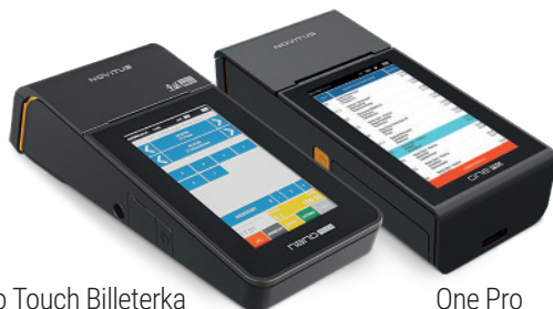
Nano Touch Billeterka